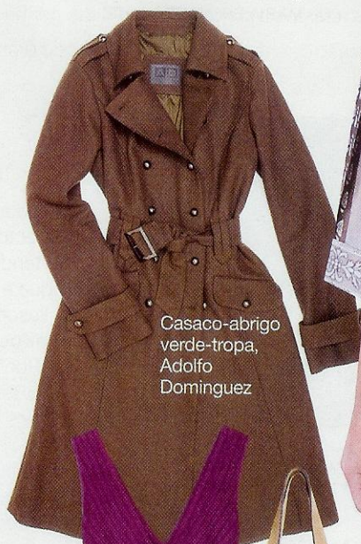
Casaco-abrigo verde-tropa, Adolfo Dominguez