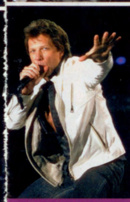
Bon Jovi arrasou