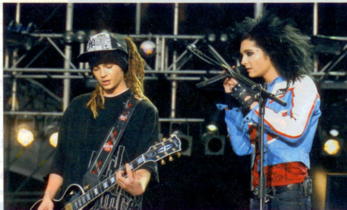
Os Tokio Hotel provocaram autênticas reações de histerismo

Ao terceiro dia, com 70 mil pessoas, o Rock in Rio virou-se para a família, aproveitando o dia Mundial da Criança. Os mais novos divertiram-se com as Docemania, Just Girls e 4 Taste. Seguiram-se os Xutos e Pontapés, que deliciaram várias gerações no mesmo espectáculo. A loucura veio com os Tokio Hotel, ao pé dos quais deveremos usar tampões nos ouvidos porque as gargantas das fãs são autênticas facas nos tímpanos. Por fim, Joss Stone e Rod Stewart.