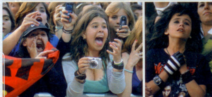
As adolescentes estavam completamente rendidas à banda