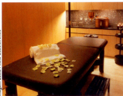
Imagem Lúcia Piloto Cabeleireiros