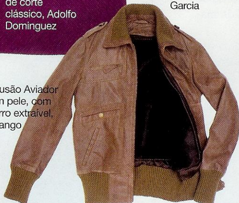
Blusão Aviador em pele, com forro extraível, Mango