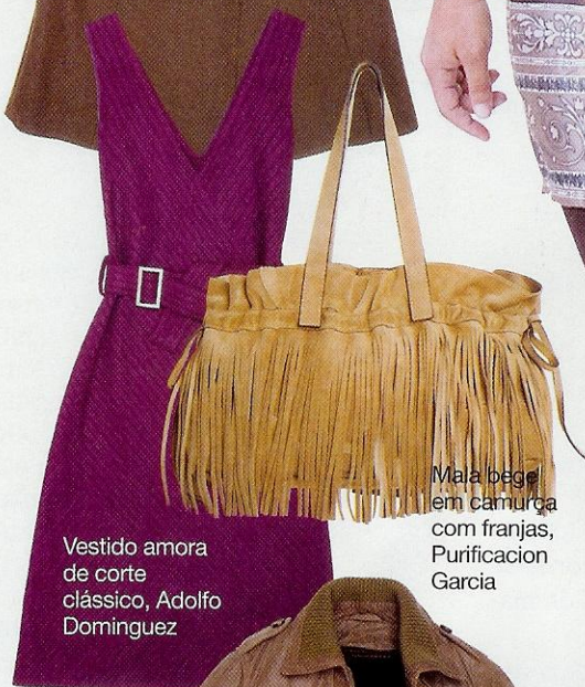
Vestido amora de corte clássico, Adolfo Dominguez