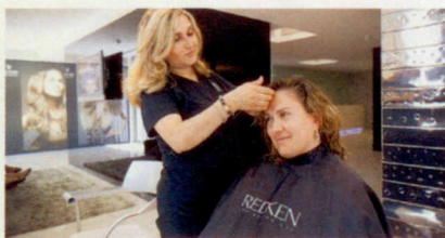
A nossa leitora pediu à hairstylist que não lhe cortasse muito o cabelo