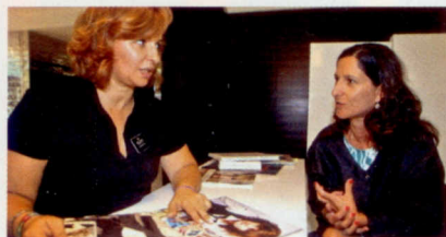
A nossa leitora tinha o cabelo comprido e entregou-se às mãos da hairstylist

Professora de Biologia, a nossa leitora comemorou a mudança de visual com um jantar com o marido e os dois filhos e está apostada em manter o novo look