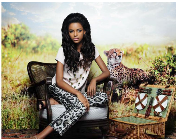
AFRICAN HEART Do continente africano, chega-nos o calor, a vivacidade das cores e a diversidade das espécies. Este look remete-nos para a bravura e nobreza presentes na savana. A naturalidade do cabelo solto, com caracóis largos e pontas descaídas sobrepõe-se a altivez conseguida através do volume e do efeito soprado no topo da cabeça. 3/6